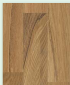
Eiche rustikal plus lackiert oder natur geölt