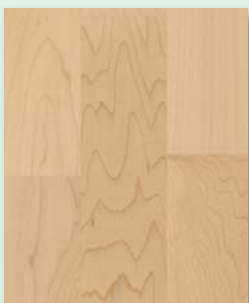
Ahorn natur (Kanadischer Ahorn) lackiert oder natur geölt