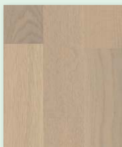
Donau-eiche rustikal weiß lackiert