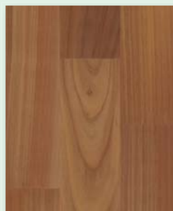
Kirschbaum natur (Europ. Kirschbaum) lackiert oder natur geölt