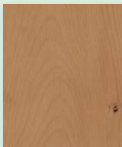
Buche Standard längsseitig gefast natur geölt