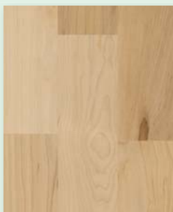
Ahorn rustikal (Kanadischer Ahorn) lackiert oder natur geölt