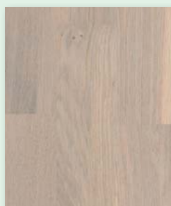
Eiche rustikal weiß gebürstet weiß geölt

Holz ist seit Jahrtausenden der Inbegriff von Wohnkultur. Seine Natürlichkeit und Wärme strahlen Behaglichkeit aus. Echtholz am Boden ist stabil und beständig, gleichzeitig aber auch lebendig und einmalig. Der nachwachsende Baustoff Holz ist naturgegeben hygroskopisch, das bedeutet, es nimmt Feuchtigkeit auf und gibt sie wieder dosiert an die Luft ab. Dadurch ergibt sich ein positives Raumklima. Allergiker schätzen es sehr. Das variantenreiche HOLZLOC 3-Stab Schiffsboden-Parkett erhalten Sie in vielen exklusiven Holzarten – von harmonisch ruhigen Sortierungen bis hin zu lebhaften, urwüchsigen Optiken.