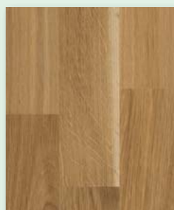
Eiche rustikal lackiert oder natur geölt