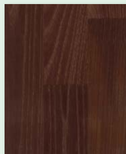
Akazie gedämpft natur geölt