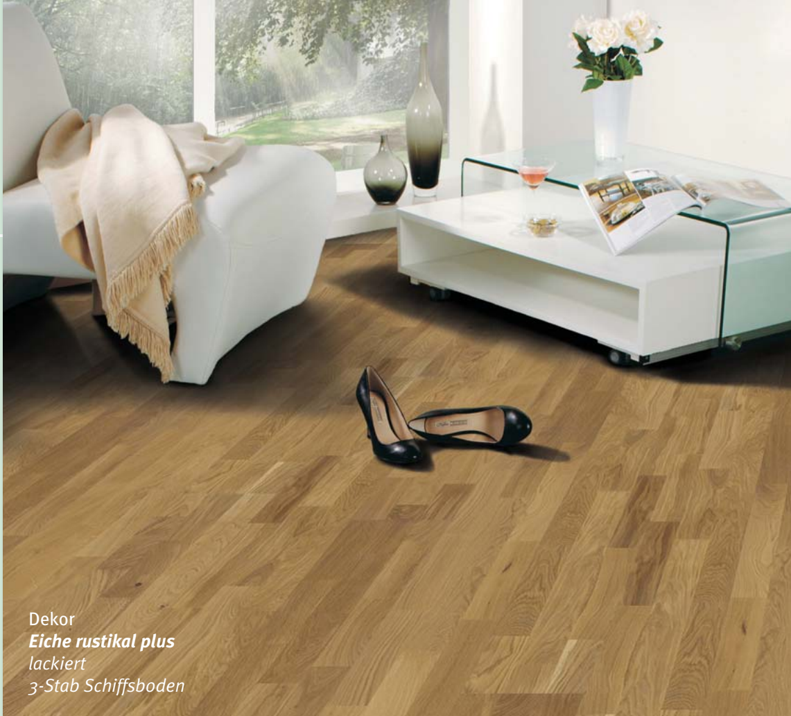
Dekor Eiche rustikal plus lackiert 3-Stab Schiffsboden