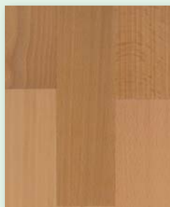
Buche natur lackiert oder natur geölt