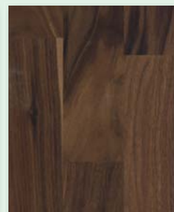
Nussbaum rustikal (Amerik. Nussbaum) natur geölt