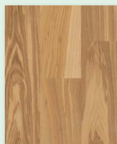
Esche rustikal natur geölt