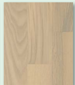
Esche rustikal weiß lackiert