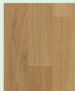
Eiche natur lackiert oder natur geölt