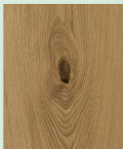
Eiche rustikal plus lackiert oder natur geölt