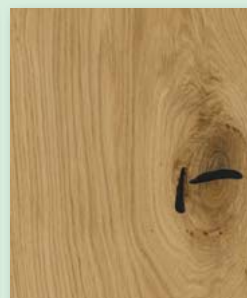
Eiche super rustikal 4-seitig gefast natur geölt, gebürstet