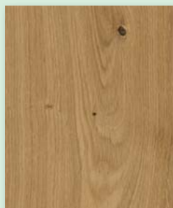
Eiche natur längsseitig gefast natur geölt