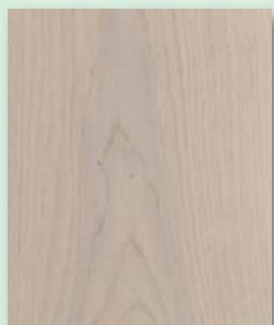
Eiche natur pearlwhite perlweiß lackiert

Ganz gleich, ob Sie einen klassischen oder einen modernen Look bevorzugen. HOLZLOC bietet mit seinen Qualitäts-Landhausdielen zahlreiche Möglichkeiten der Raumgestaltung. Von hellen bis zu dunklen Holzarten oder lackierten und geölte Oberflächen. Jeder Boden ist ein Unikat. Mit HOLZLOC entscheiden Sie sich für ein Qualitätsboden, der dank seines dreischichtigen Dielenaufbaus sehr formstabil und damit auch bestens für die Verwendung über Fußbodenheizung geeignet ist.