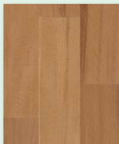
Buche rustikal lackiert oder natur geölt

Dekor Esche rustikal natur geölt 3-Stab Schiffsboden